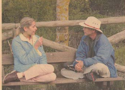
Conversación: la filosofía de Pueblo Inglés

"Te alojas en un ambiente rural y recibes clases al estilo Sócrates. La aldea es el aula." es lo que siente alguno de los participantes que ya ha asistido al programa.