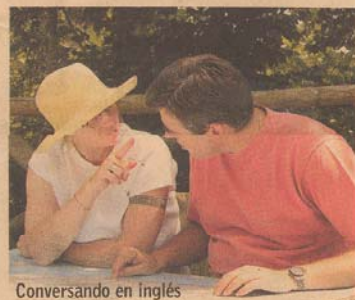
Conversando en inglés