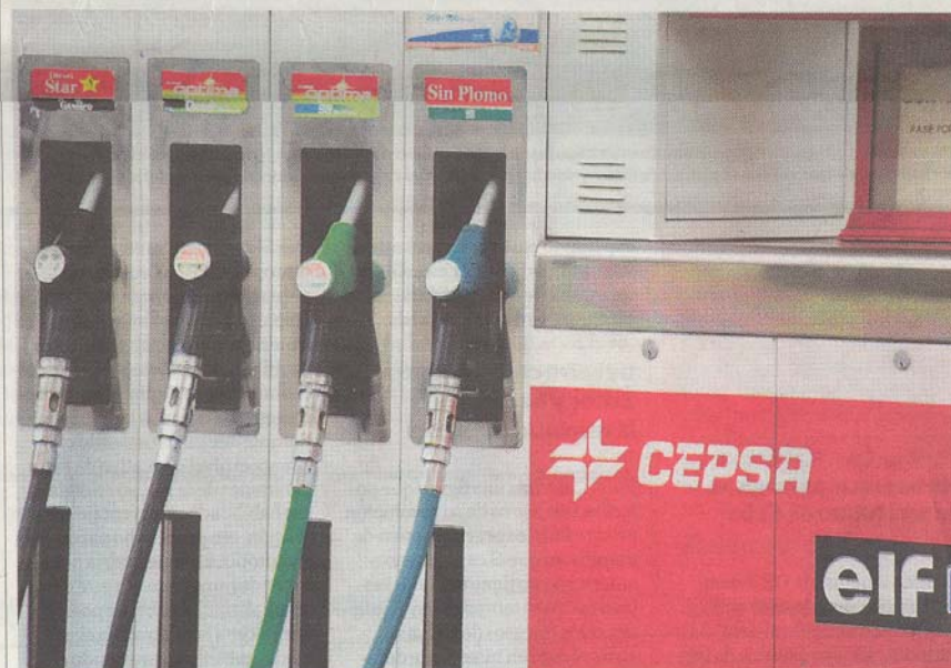
Una de las gasolineras que Cepsa tiene en Madrid. GUILLERMO RODRÍGUEZ